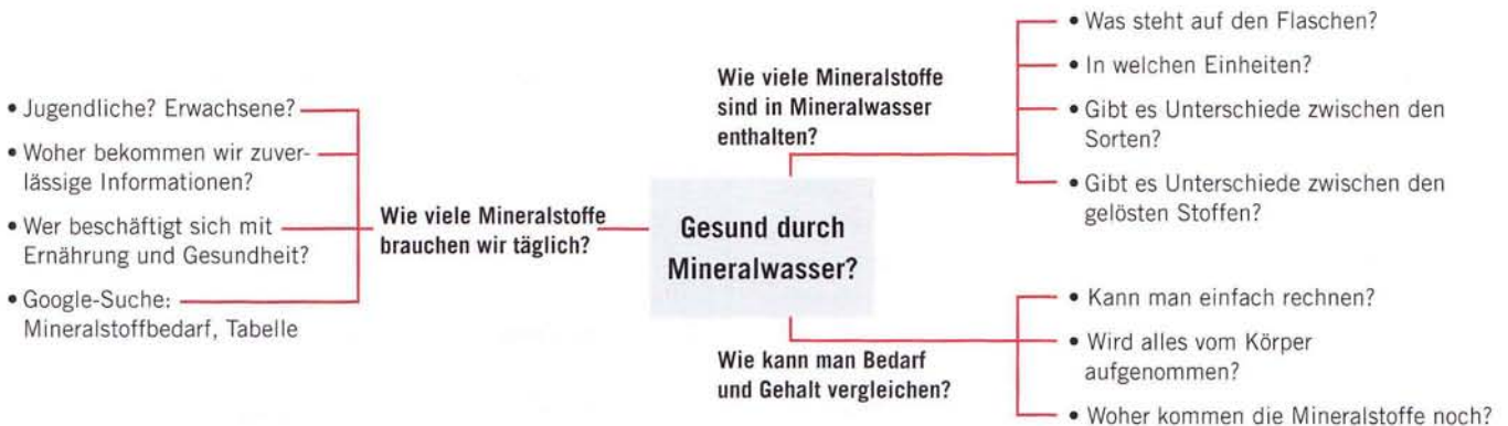
1: Strukturierung des Problems in Form einer Mind-Map

An die Diskussion der Ergebnisse, bei der herausgestellt wird, dass natürliche Wässer mehr oder weniger viel Mineralstoffe enthalten, schließt sich die Frage an, ob man tatsächlich der Werbung (Kasten 1) trauen darf: Deckt der Konsum von Mineralwasser einen sehr großen Teil des Mineralstoffbedarfs eines Menschen? Die zu lösende Aufgabe kann im Ansatz gemeinsam mit den Schülerinnen und Schülern entwickelt werden. Das zunächst vage formulierte Problem lautet: